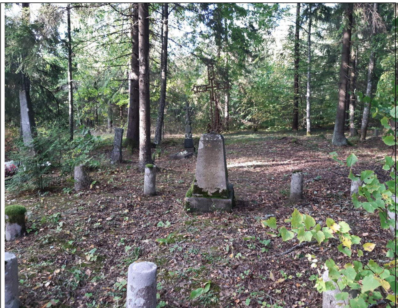
Kultūros vertybės kodas 21209