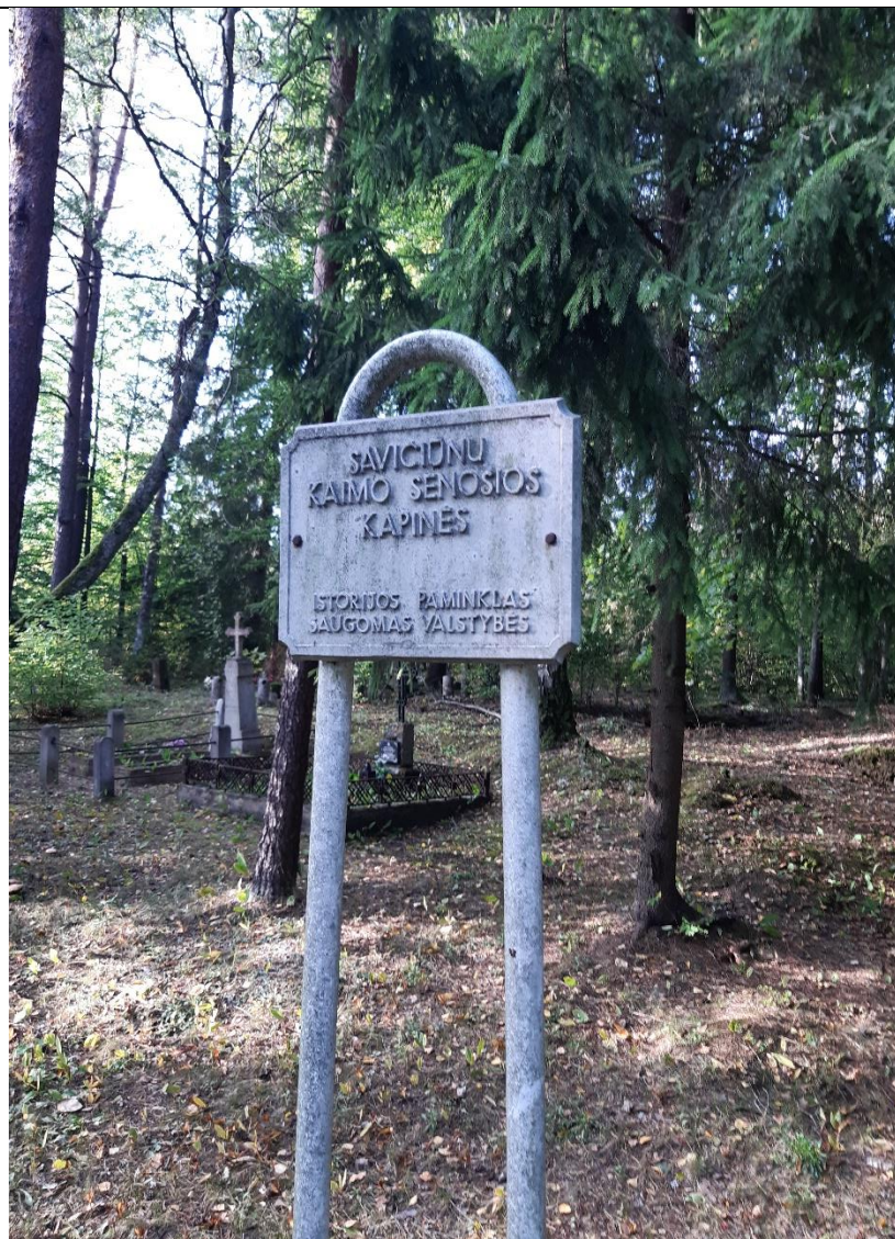
Kultūros vertybės kodas 21209